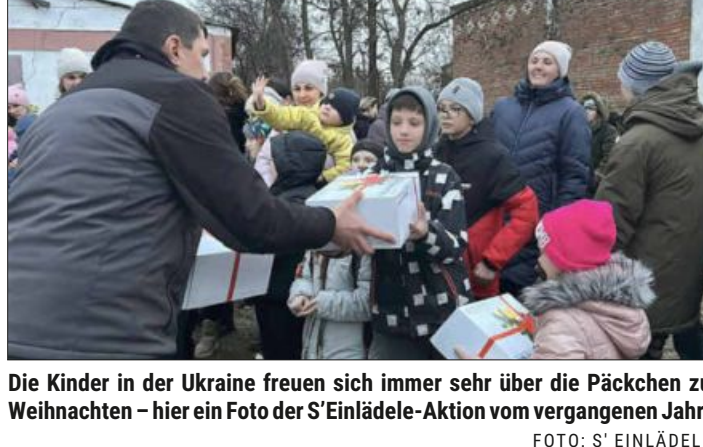
Die Kinder in der Ukraine freuen sich immer sehr über die Päckchen zu Weihnachten – hier ein Foto der S'Einlädelle-Aktion vom vergangenen Jahr.